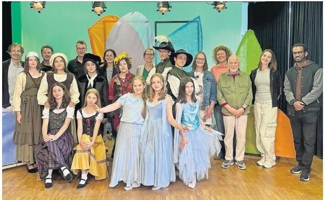
Mitwirkende und Kooperationspartner*innen vor dem Bühnenbild für den „Sturz in den Mummelsee“.

Die Hauptgruppe präsentiert die Eröffnungsszene „Der Traum vom Ständebaum“ aus der diesjährigen Jahresproduktion