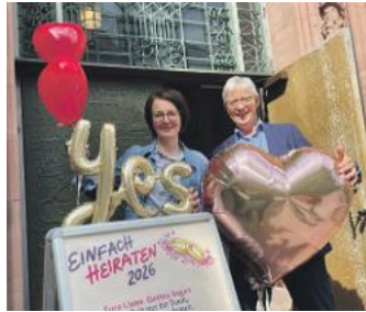
Einfach heiraten: Seite 3.

+++ Eine kleine Drohne ist für die Stadtverwaltung unterwegs: Seite 5 +++ Hoch3-Firmenlauf am 26. Juni bereits ausgebucht: Seite 5 +++ Im Juni wird wieder gemäht: Seite 6 +++ Die Junge Theaterakademie tritt auf: Seite 12 +++