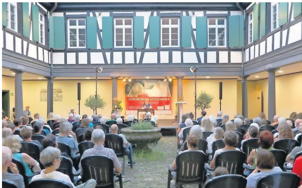
Lesen in lauschiger Atmosphäre ist im August wieder angesagt.

Beim Offenburger Lesesommer kann man erleben, dass sich Sommer, Sonne und Literatur bestens ergänzen. Im Kreuzgang des alten Kapuzinerklosters oder bei unbeständigem Wetter in der Aula des Grimelshausen-Gymnasiums werden von Montag, 10. August, bis Freitag, 14. August, wieder jeden Abend ab 20 Uhr persönliche literarische Kostproben präsentiert – frei nach dem Lesesommer-Motto: „Wer Mut hat, liest vor! Wer Lust hat, hört zu!“ Die Stadtbibliothek Offenburg, das Kulturbüro Offenburg, die Volkshochschule Offenburg sowie die Buchhandlungen Roth und Akzente laden zu dem kostenlosen sommerlichen Vorlese- und Zuhörvergnügen ein. Dazu suchen sie nun 25 passionierte Vorleserinnen und Vorleser, die bereit sind, aus einem ihrer Lieblingsbücher 15 Minuten lang vor Publikum zu lesen.