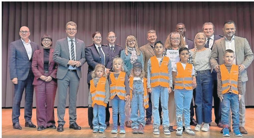
Die Vergabe des Integrationspreises hat Tradition.

Den besten Projekten winken Preisgelder in Höhe von insgesamt 5.000 Euro. Bewerbungen