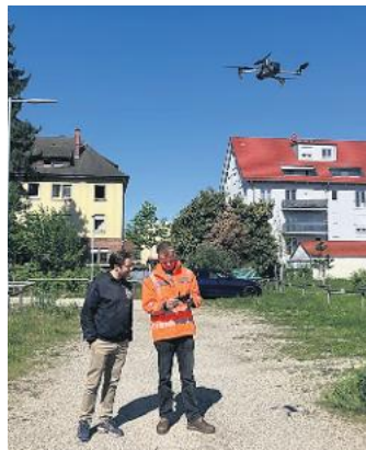
Städtische Mitarbeiter testen die Drohne.

Die fliegende Kamera interessiert sich ausschließlich für Gebäude, Brücken und