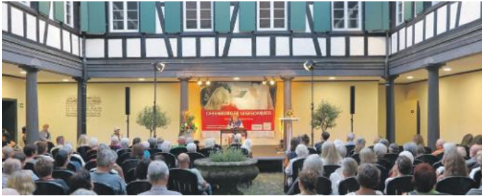
Der Lesesommer hält wieder Einzug: Seite 2