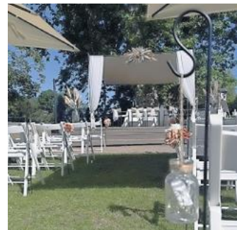
Traumhafte Kulisse.

Kulisse, um bei einem selbst organisierten Sektempfang auf das frische Glück anzustoßen. Und sollte das Sommerwetter nicht mitspielen, wird die Trauung unkompliziert in das Trauzimmer im historischen Rathaus verlegt.