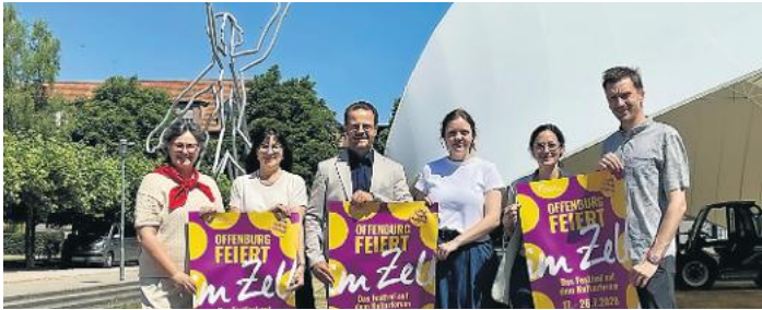
Offenburg in Feierlaune und im Zelt: Seite 5