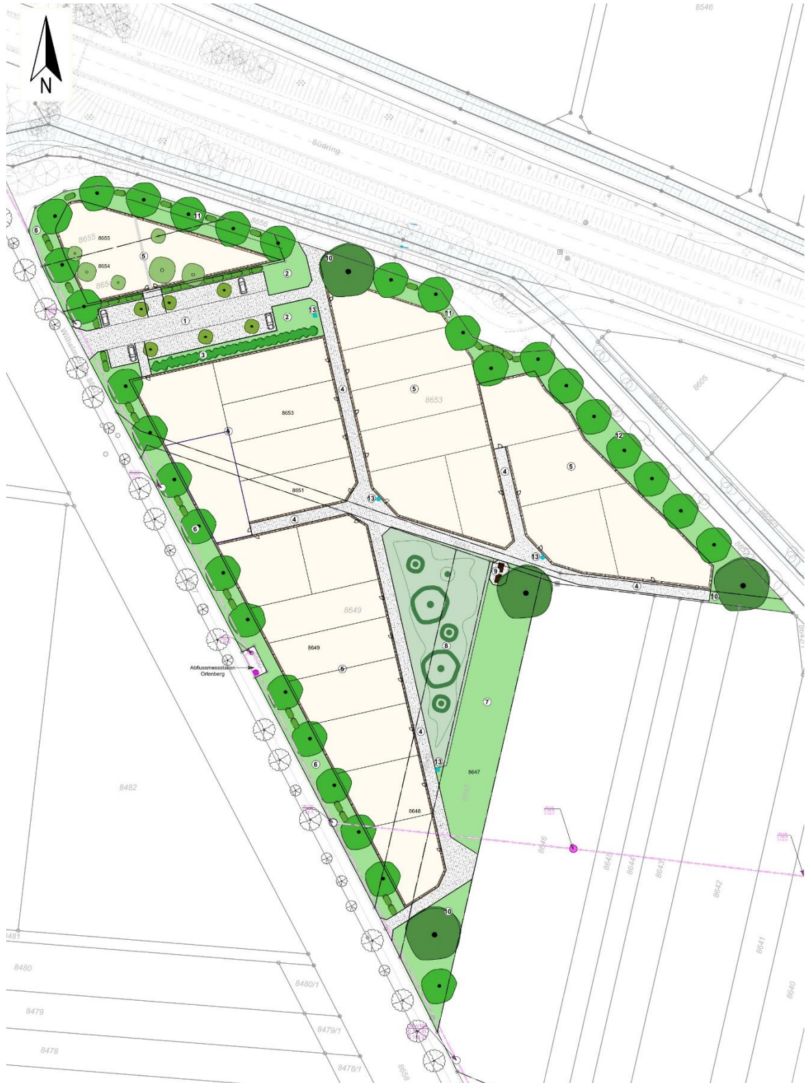
Abb. 3: Entwurfsplanung Kleingärten Grien, ohne Maßstab