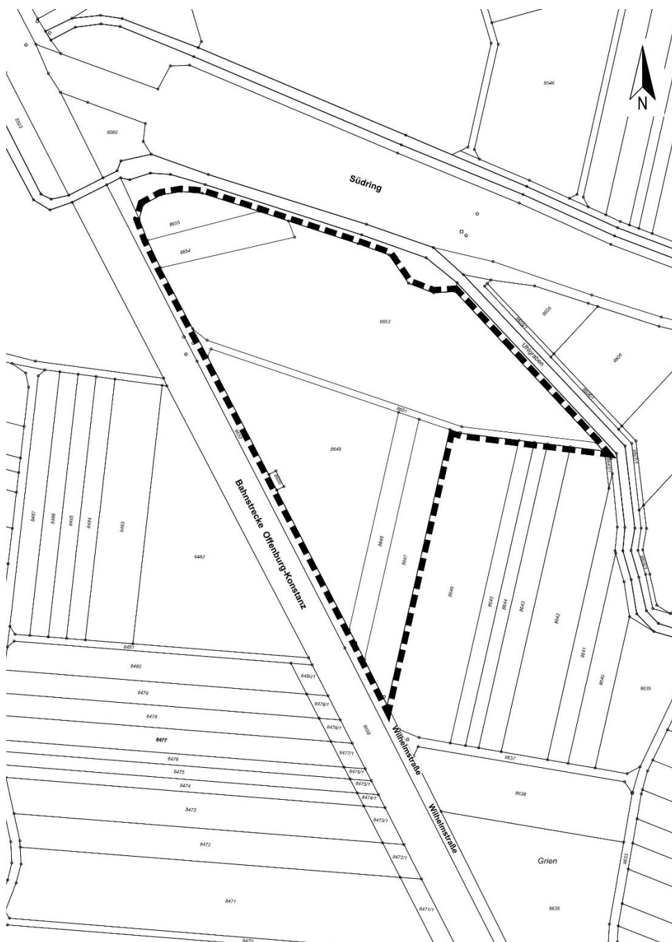
Abb. 1: Lageplan mit Umgrenzung des Plangebiets (Geltungsbereich), ohne Maßstab

Insgesamt umfasst das Plangebiet eine Fläche von ca. 1,74 ha. Die genaue Abgrenzung des Plangebiets ist der folgenden Darstellung sowie der Planzeichnung zu entnehmen.