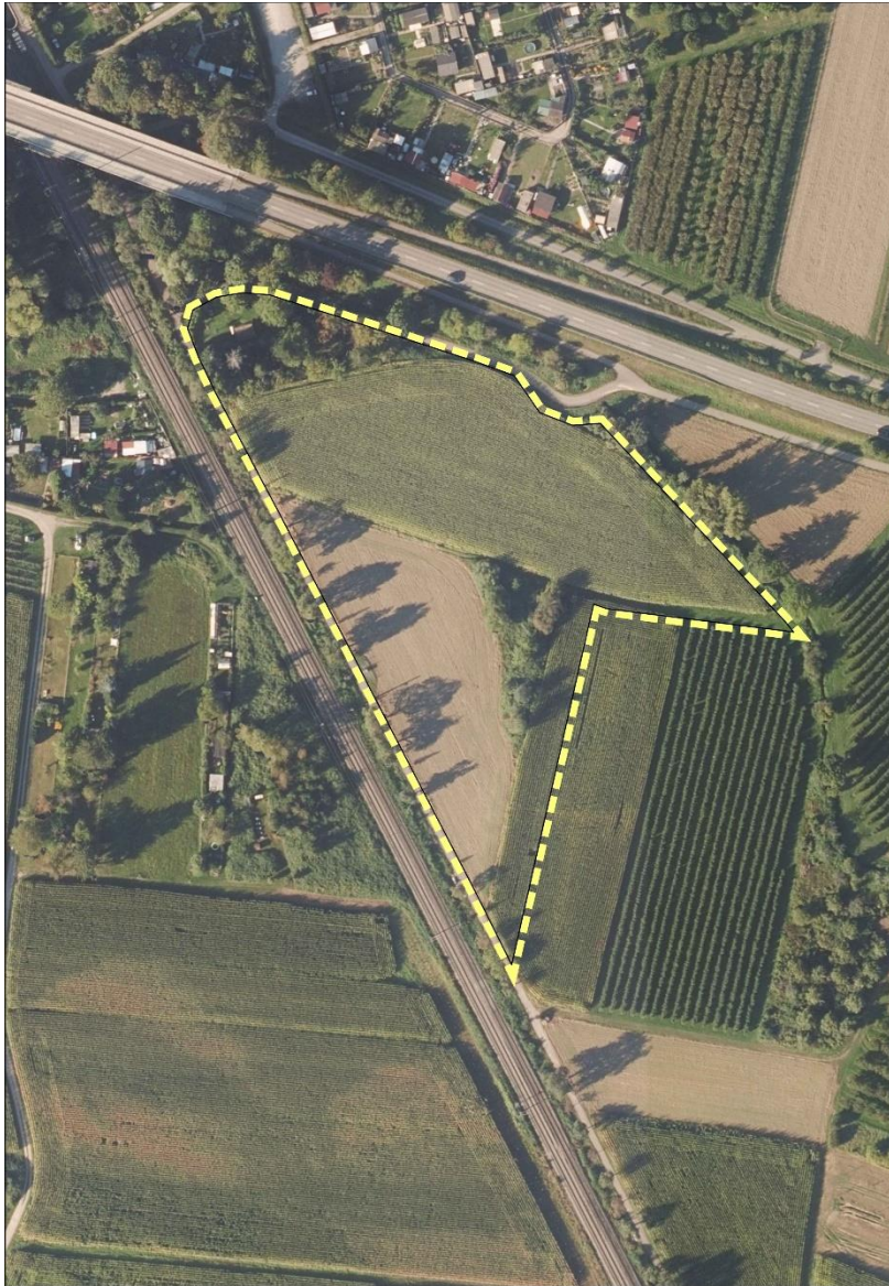
Abb. 2: Luftbild mit Umgrenzung des Plangebiets (Geltungsbereich), ohne Maßstab

Das Plangebiet liegt südlich des Südrings und östlich der Bahnstrecke Richtung Gengenbach und ins Kinzigtal. Nördlich und östlich grenzt der Uhlgraben an. Südlich angrenzend erstreckt sich freie Landschaft mit ackerbaulicher/landwirtschaftlicher Nutzung. Das Gebiet ist nahezu eben.